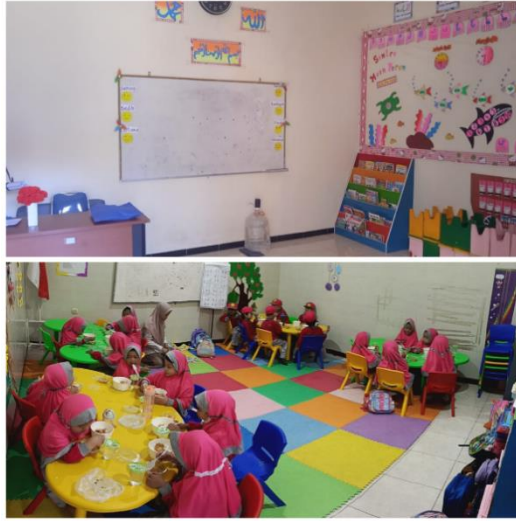
Gambar 2. Ruang Kelas

tahun 2023 dibangun lagi gedung baru satu lantai dengan tiga kelas tambahan. Ini menunjukkan adanya upaya serius untuk memenuhi kebutuhan ruang belajar yang meningkat seiring bertambahnya jumlah siswa.