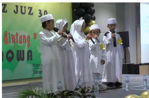
Gambar 5. Wisudawan Tahfidz

Pada tabel 1. Data Tahfidz Juz 30 jumlah wisudawan tahfidz pada tahun ajaran 2020/2021 sebanyak 3 siswa. Pada tahun ajaran 2021/2022 sebanyak 4 siswa wisudawan tahfidz. Kemudian pada tahun ajaran 2022/2023 jumlah wisudawan tahfidz sebanyak 5 siswa. Selanjutnya pada tahun ajaran 2023/2024 jumlah wisudawan tahfidz sebanyak 5 siswa dan pada tahun ajaran 2024/2025 jumlah wisudawan tahfidz sebanyak 8 siswa. Hal ini dapat disebabkan oleh faktor internal maupun eksternal seperti perbedaan karakteristik siswa atau kondisi belajar. Namun secara umum, capaian ini menunjukkan keberhasilan program tahfidz yang menjadi bagian dari keunggulan lembaga.