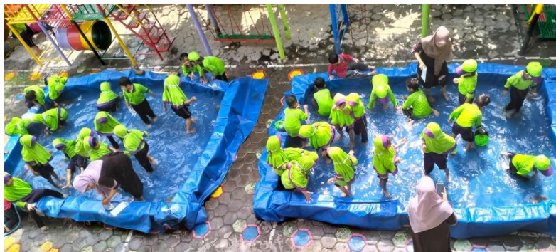
Gambar 3. P5 Menangkap Ikan

Pada Gambar 3. P5 (Projek Penguatan Profil Pelajar Pancasila) Menangkap Ikan mengangkat tema 'Mengenal Macam-Macam Ciptaan Allah', dengan subtema 'Ikan Hias'. Melalui kegiatan ini, nilai-nilai Pancasila yang tercermin antara lain adalah sila pertama, yaitu Ketuhanan Yang Maha Esa, yang ditanamkan melalui pengenalan dan rasa syukur terhadap ciptaan Allah; serta sila kelima, Keadilan Sosial bagi Seluruh Rakyat Indonesia, yang dapat diimplementasikan melalui sikap peduli terhadap lingkungan dan makhluk hidup di sekitar. Materi tilawati merupakan salah satu materi pengajaran mengenal huruf hijaiyah yang menawarkan suatu sistem pembelajaran yang mudah, efektif dan efisien demi mencapai kualitas pemahaman membaca huruf hijaiyah. Prinsip dalam materi tilawati yaitu diajarkan secara praktis, menggunakan lagu rost, diajarkan secara klasikal menggunakan peraga, serta diajarkan secara individual dengan tehnik baca simak menggunakan buku [22].