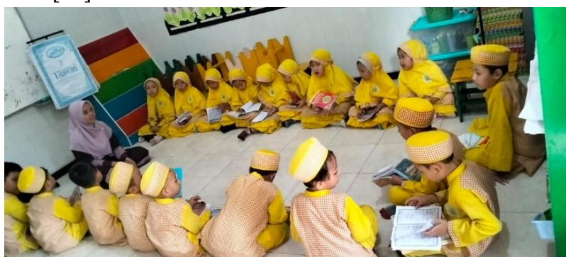
Gambar 4. Kegiatan Pembelajaran Tilawati

Pada Gambar 3. P5 (Projek Penguatan Profil Pelajar Pancasila) Menangkap Ikan mengangkat tema 'Mengenal Macam-Macam Ciptaan Allah', dengan subtema 'Ikan Hias'. Melalui kegiatan ini, nilai-nilai Pancasila yang tercermin antara lain adalah sila pertama, yaitu Ketuhanan Yang Maha Esa, yang ditanamkan melalui pengenalan dan rasa syukur terhadap ciptaan Allah; serta sila kelima, Keadilan Sosial bagi Seluruh Rakyat Indonesia, yang dapat diimplementasikan melalui sikap peduli terhadap lingkungan dan makhluk hidup di sekitar. Materi tilawati merupakan salah satu materi pengajaran mengenal huruf hijaiyah yang menawarkan suatu sistem pembelajaran yang mudah, efektif dan efisien demi mencapai kualitas pemahaman membaca huruf hijaiyah. Prinsip dalam materi tilawati yaitu diajarkan secara praktis, menggunakan lagu rost, diajarkan secara klasikal menggunakan peraga, serta diajarkan secara individual dengan tehnik baca simak menggunakan buku [22].