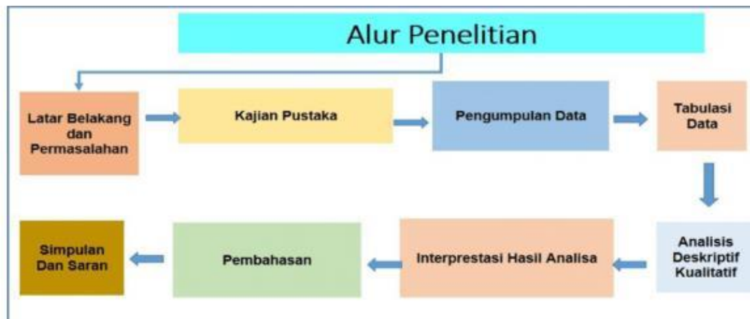
Gambar 1. Alur Penelitian Kualitatif

Untuk menjamin validitas data, penelitian ini menggunakan teknik triangulasi metode, yaitu dengan membandingkan data dari berbagai sumber (observasi, wawancara, dan dokumentasi). Selain itu, dilakukan member checking kepada guru sebagai informan untuk memastikan bahwa interpretasi data sesuai dengan pengalaman dan pandangan mereka. Proses ini diperkuat melalui diskusi dengan rekan sejawat, guna menghindari bias subjektivitas peneliti dan memperoleh pandangan reflektif terhadap temuan penelitian. Melalui pendekatan ini, penelitian diharapkan dapat memberikan gambaran holistik, mendalam, dan praktis mengenai implementasi strategi linguistik terapan berbasis bermain, khususnya dalam konteks penerapan Kurikulum Merdeka di pendidikan anak usia dini. Proses dan tahapan pelaksanaan penelitian ini dirangkum secara sistematis dalam ilustrasi alur penelitian yang dilakukan.