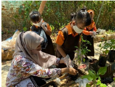
Gambar 2. Kegiatan Menanam Pohon

Pertama, Kegiatan menanam. Bentuk aktivitas yang pertama dalam kegiatan taman sekolah yaitu menanam. Menanam merupakan salah satu aktivitas yang disenangi oleh anak-anak. Guru memberi kebebasan anak untuk memilih diantara pohon atau bunga yang akan ditanam. Proses penanaman dimulai dengan mengenalkan tanaman, media tanam, dan cara penanaman yang benar. Guru B3 menyatakan, “anak-anak itu sangat semangat saat mereka dikasih kesempatan untuk memilih tanaman yang akan ditanam”. Selain itu, anak-anak juga diajak untuk menghias pot guna meningkatkan kreativitas dan rasa kepemilikan. Dengan melakukan kegiatan ini, guru mulai menanamkan nilai tanggung jawab dan rasa cinta terhadap alam kepada anak.