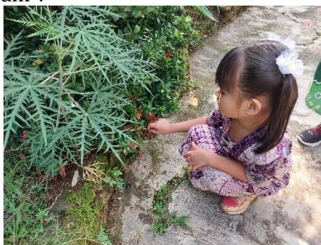
Gambar 5. Kegiatan Mengamati Tumbuhan

Keempat, Kegiatan Mengamati. Aktivitas ini diintegrasikan dengan tema “Aku sayang Bumi”. Setelah dilakukan kegiatan menanam, guru melakukan pengamatan terhadap anak-anak dan dicatat pertumbuhan tanaman mereka secara berkala. Guru menyediakan gambar observasi yang sesuai dengan kemampuan anak, yang berisi mengenai jumlah daun, tinggi tanaman, dan warna batang atau bunga. Selain itu, guru juga mendorong anak untuk membuat gambar tanaman mereka sebagai sarana untuk menunjukkan kreativitas. Selain menumbuhkan rasa ingin tahu pada anak, kegiatan ini dapat mengembangkan rasa fokus dan memperoleh pemahaman yang mendalam tentang tumbuhan. Anak-anak dapat belajar bahwa tanaman merupakan makhluk hidup yang harus dirawat dan dijaga. Guru kelompok B1 menambahkan “kegiatan mengamati ini bisa membangun rasa ingin tahu dan membantu anak-anak mengembangkan hubungan emosional dengan alam”.