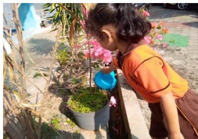
Gambar 3. Kegiatan menyiram tanaman secara rutin

Kedua, Menyiram tanaman. Kemudian bentuk kegiatan yang kedua adalah aktivitas menyiram yang dilakukan pagi hari secara rutin. Anak-anak diminta untuk menyiram tanaman yang ada di taman dan halaman sekolah. Kegiatan ini membantu anak dalam mengembangkan sikap disiplin serta memberikan pemahaman betapa pentingnya air sebagai sumber kehidupan makhluk hidup. Selanjutnya guru melibatkan anak-anak dengan memberikan pertanyaan reflektif untuk menumbuhkan kesadaran ekologis anak, seperti “apa yang akan terjadi jika tanaman tidak disiram?”.