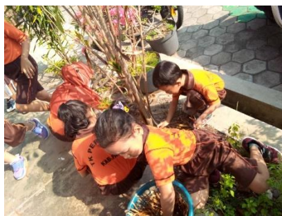
Gambar 4. Membersihkan rumput dan sampah

Keempat, Kegiatan Mengamati. Aktivitas ini diintegrasikan dengan tema “Aku sayang Bumi”. Setelah dilakukan kegiatan menanam, guru melakukan pengamatan terhadap anak-anak dan dicatat pertumbuhan tanaman mereka secara berkala. Guru menyediakan gambar observasi yang sesuai dengan kemampuan anak, yang berisi mengenai jumlah daun, tinggi tanaman, dan warna batang atau bunga. Selain itu, guru juga mendorong anak untuk membuat gambar tanaman mereka sebagai sarana untuk menunjukkan kreativitas. Selain menumbuhkan rasa ingin tahu pada anak, kegiatan ini dapat mengembangkan rasa fokus dan memperoleh pemahaman yang mendalam tentang tumbuhan. Anak-anak dapat belajar bahwa tanaman merupakan makhluk hidup yang harus dirawat dan dijaga. Guru kelompok B1 menambahkan “kegiatan mengamati ini bisa membangun rasa ingin tahu dan membantu anak-anak mengembangkan hubungan emosional dengan alam”.