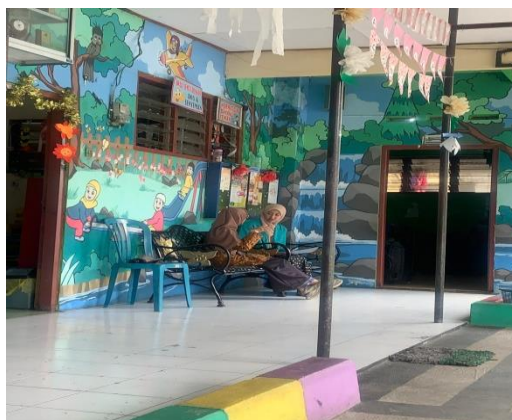
Gambar 1. Wawancara dengan wali kelas

sifat ukhuwah dan tolong menolong. Ketiga, akhlak kepada manusia dalam hal ini kepada diri sendiri yakni, sifat ikhlas. Keempat, akhlak kepada manusia dalam hal ini kepada keluarga (orang tua) yakni birrul walidain (berbakti kepada orang tua). [20].