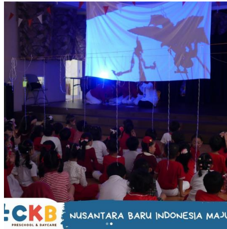
Gambar 6. Pemanfaatan Teknologi dalam Pembelajaran

Setelah kurikulum diterapkan, kepala sekolah perlu memantau pelaksanaannya secara rutin untuk memastikan kesesuaian dengan rencana dan mengidentifikasi tantangan dalam pembelajaran [37]. Manajemen kurikulum kombinasi memerlukan fleksibilitas dan kreativitas mengingat perubahan dalam kebutuhan pendidikan, perkembangan anak, kebijakan, dan teknologi. Oleh karena itu, kepala sekolah dan guru harus beradaptasi, menyesuaikan strategi, dan membuat penyesuaian berdasarkan umpan balik evaluasi untuk menciptakan pengalaman belajar yang relevan dan efektif.