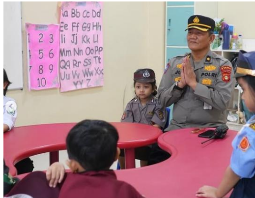
Gambar 5. Kolaborasi Orang Tua Sebagai Pengajar

Dengan demikian, evaluasi berperan penting dalam menciptakan sistem pendidikan yang adaptif dan responsif terhadap kebutuhan anak, serta memastikan kualitas pengajaran yang konsisten dan berdampak positif pada perkembangan anak secara menyeluruh. Langkah Keempat, Implementasi kurikulum kombinasi. Implementasi yang efektif memerlukan kolaborasi antara kepala sekolah, guru, orang tua, dan anak untuk memastikan kurikulum mendukung pencapaian tujuan pendidikan secara maksimal [35]. Informan A4, Kepala Sekolah TK Cipta Kreatif Bangsa (CKB), menjelaskan bahwa: ... Sekolah ini aktif berkolaborasi dengan orang tua melalui workshop atau seminar parenting untuk membangun pemahaman bersama mengenai perkembangan anak. Selain itu, orang tua juga terlibat dalam pembelajaran, seperti berperan sebagai pengajar atau membantu menyiapkan bahan ajar, misalnya dengan membawa buah jeruk untuk kegiatan pembelajaran. Kolaborasi ini memperkaya pengalaman belajar anak dan mendukung tumbuh kembang mereka secara efektif... [32]