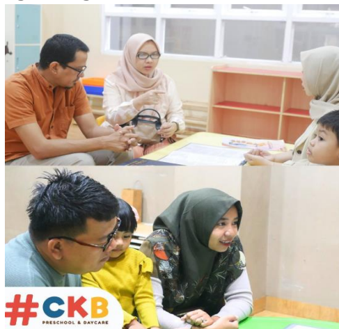
Gambar 1. Kegiatan Observasi

menentukan jika ada area yang membutuhkan dukungan lebih lanjut. Jika ditemukan gangguan perkembangan, seperti ADHD, sekolah bekerja sama dengan orang tua untuk melakukan tes psikologi lanjutan, sehingga kebutuhan belajar anak dapat dipahami lebih baik. Strategi pembelajaran yang disesuaikan, seperti menciptakan lingkungan belajar minim distraksi dan pembagian tugas kecil, diterapkan untuk mendukung anak dengan kebutuhan khusus tersebut. Statemen tersebut diperkuat dengan apa yang disampaikan oleh informan A2 selaku guru di TK CKB: ... Kemudian, wawancara dengan orang tua dilakukan untuk memahami kebiasaan, minat, gangguan, dan tantangan anak di rumah, yang memberikan wawasan lebih dalam tentang aspek emosional, fisik, dan sosial anak, serta mendukung penciptaan lingkungan belajar yang sesuai. Evaluasi kinerja akademik dilakukan melalui penilaian mingguan untuk mengidentifikasi kebutuhan dukungan lebih lanjut. Jika ditemukan gangguan seperti ADHD ( Attention Deficit Hyperactivity Disorder ), sekolah bekerja sama dengan orang tua untuk tes psikologi lanjutan, guna merancang strategi pembelajaran yang meliputi lingkungan belajar minim distraksi, pembagian tugas kecil, dan aktivitas fisik... [24]