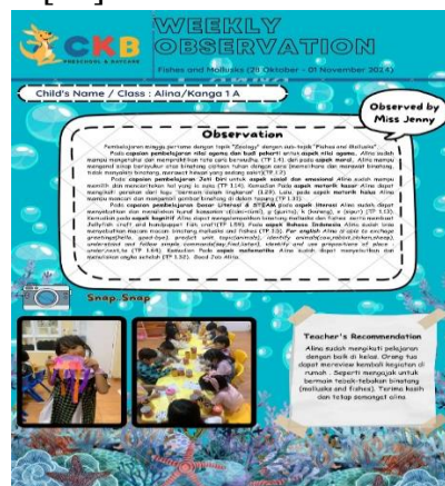
Gambar 4. Laporan Mingguan Perkembangan Anak

Langkah ketiga, yaitu evaluasi berkala. Evaluasi berkala dalam manajemen kurikulum kombinasi penting untuk memastikan relevansi dan pencapaian tujuan pembelajaran [33]. Evaluasi ini membantu mengidentifikasi kegiatan yang perlu disesuaikan dan memberikan informasi bagi perbaikan kurikulum, guna meningkatkan efektivitas pembelajaran dan mendukung perkembangan anak secara optimal [34]. Kemudian, Informan A2, guru di TK Cipta Kreatif Bangsa (CKB), menjelaskan bahwa: ... Evaluasi anak dilakukan setiap minggu, mencakup aspek akademik, sosial, emosional, dan keterampilan lainnya, dengan laporan yang disampaikan kepada orang tua beserta rekomendasi kegiatan di rumah. Evaluasi pembelajaran dilakukan secara berkala untuk menilai efektivitas metode dan materi, serta untuk perbaikan pendekatan yang sesuai dengan kebutuhan anak. Selain itu, evaluasi kinerja guru dilakukan setiap bulan, memberikan umpan balik konstruktif untuk meningkatkan kualitas pengajaran dan mendukung perkembangan anak... [24].